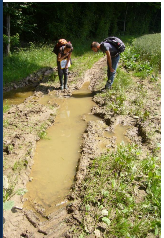
Les ornières forestières bien ensoleillées sont très appréciées par le Sonneur à ventre jaune