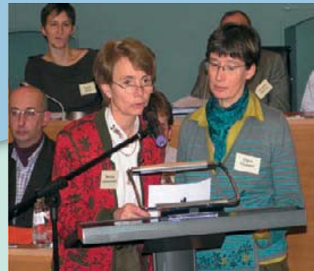
Parlement de la Région wallonne, décembre 2006. Les panélistes wallons présentent leurs conclusions sur l'avenir de la ruralité wallonne aux autorités et institutions concernées