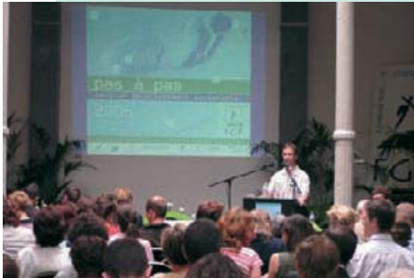
Proclamation des 20 lauréats de l'Appel à initiatives, juin 2006