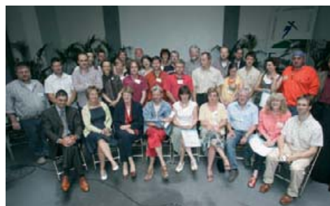
Les 20 lauréats de l'Appel « Pas à pas », cuvée 2006, le 20 juin à Bruxelles.

De nombreuses initiatives de terrain prouvent qu'il est possible de faire évoluer ses projets dans le sens d'un développement plus soutenable. En 2006, grâce à cet appel, la Fondation a reçu et analysé 112 dossiers de candidatures. Après une première sélection, 45 d'entre eux ont pu bénéficier d'une formation de 3 jours destinée à les aider à améliorer leur projet. Après la sélection finale, 20 d'entre eux ont en outre reçu un coup de pouce financier et un accompagnement. Les critères de sélection : l'aspect soutenable de la démarche que les projets actionnent, leur caractère novateur et la possibilité pour les initiatives de s'inscrire dans la durée.