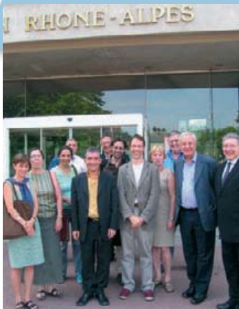
Lyon, France, juin 2006. Le Steering Committee du Panel de citoyens européen accueilli par la Région Rhône-Alpes