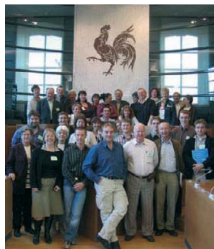
Des gens ordinaires, dans un processus encore trop extraordinaire. Choisis de manière aléatoire en ville et à la campagne, les citoyens-panélistes ont pu se forger une opinion précise et argumentée sur l'avenir de la ruralité en Wallonie.

Ce panel a été réalisé notamment avec la collaboration de Trame scl, spécialisée en matière de développement local et de ruralité. Il a bénéficié du soutien très actif du Ministre de l'Agriculture, de la Ruralité et de l'Environnement et de la Direction Générale de l'Agriculture de la Région wallonne.