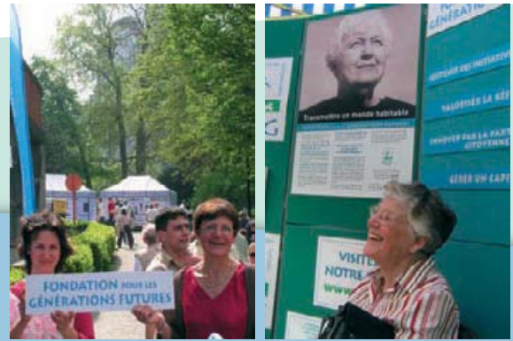
La Fondation à la rencontre du public lors de manifestations populaires