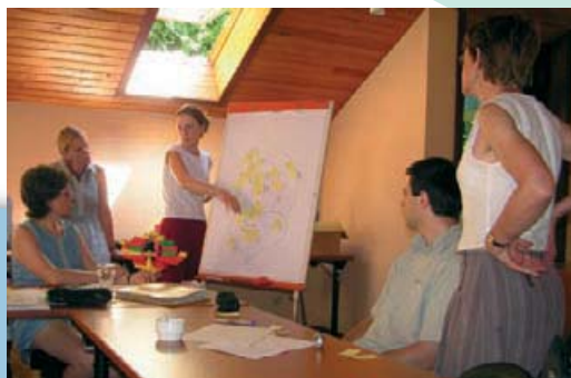
L'équipe de la Fondation en plein « brainstorming »