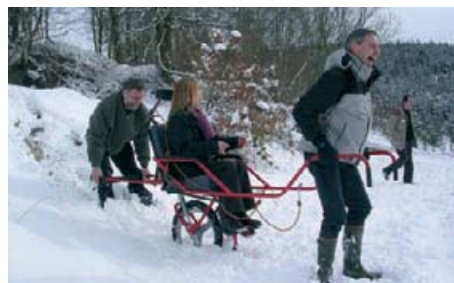
Moins valides mais pas moins intéressés à la découverte de la nature, grâce à « Nature pour tous », lauréat 2006

Le projet « Nature pour tous » de l'association Natagora ambitionne de rendre ses réserves naturelles et ses activités de découverte de la nature, à Bruxelles et en Wallonie, accessibles aussi aux personnes handicapées physiques et mentales. Le coup de pouce de la Fondation l'aide notamment à mettre sur pied un réseau de prêt de matériel adapté.