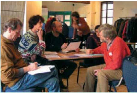
45 porteurs d'initiatives en formation grâce à « Pas à pas vers un développement soutenable » et Alter R&I