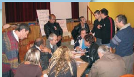
Réunion de travail animée pour les panélistes « transfrontaliers » des Carpathes. Novembre 2006