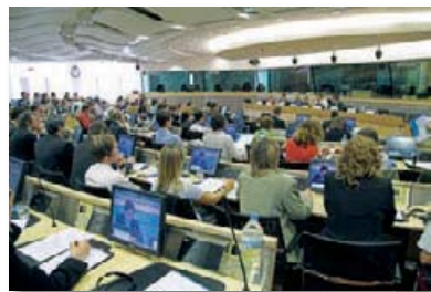
Lancement officiel du « Panel de Citoyens Européen » dans l'hémicycle du Comité des Régions de l'UE

Parmi les partenaires de niveau européen, l'on compte la Fondation Bernheim, Carnegie UK Trust, Fondation Charles L. Mayer, Fondation Evens, Fondation de France, Fondation Roi Baudouin, Rowntree Trust et NEF; ainsi que la DG Education & Culture de la Commission Européenne et le Comité des Régions de l'UE.